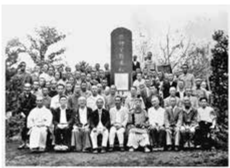
【写真】 恩師星野米松先生の景仰碑

旧会津藩士星野鉄蔵の長男米松は親子2代に亘って教員を務めた。父鉄蔵は中市源福寺で寺子屋を務め、明治8年他界。米松は明治・大正に23年間、中市小学校校長を務め、教育委員会から感謝状をうけている。米松校長は出席率向上のため、土手に花壇を作り、珍しい「宵待草、月見草」などの新品種を植え、父母を喜ばせた。また、冬は夜学を実施したり、雪くつ(つまご)や草履をつくり、校長自ら昔話、物語を教えた。 そのほか、「卵貯金会」を組織したり「なわなり貯金」を実施。珠算教育にも力を注ぎ学力向上に努めた。