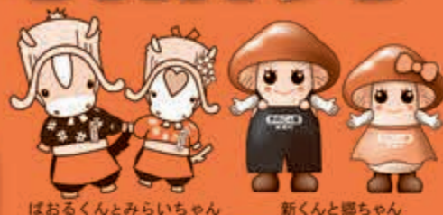
ばおるくとみらいちゃん