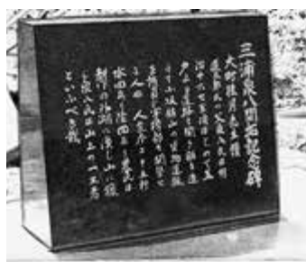
【写真】 三浦泉八記念碑