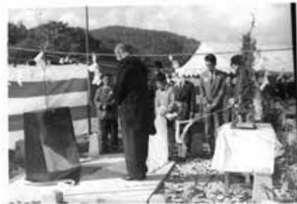
【写真】 除幕式に参加する三浦一雄さん(元農林大臣)

泉八の長男道太郎は野辺地町長や五戸27代町長をつとめ、五戸川流域24ヶ所の改修に力を注ぎ地方発展に大きな足跡を残している。 また、孫の一雄は東大法学科で農林大臣をつとめた町の名士である。