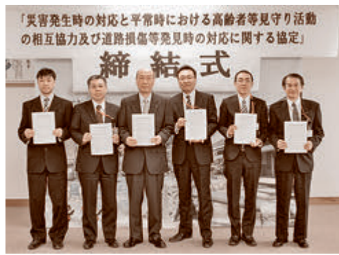
「災害発生時の対応と平常時における高齢者等見守り活動の相互協力及び道路路損傷等発見時の対応に関する協定」の締結式

場にて「災害発生時の対応と平常時における高齢者等見守り活動の相互協力及び道路路損傷等発見時の対応に関する協定」の締結式が執り行われ、日本郵便株式会社（八戸西・五戸・倉石・上市川・浅田）と五戸町との間で協定が締結されました。