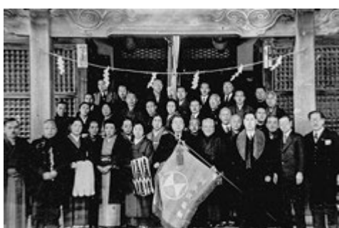
【写真】五戸地方同郷会

そして、五戸小や五戸中卒が主体となり五戸小百周年記念等の行事には多大な寄金をよせている。