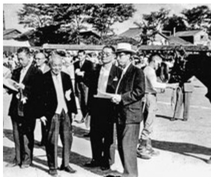
【写真】第2回青森県畜産共進会の様子

「近寄るな」と叱られた。当時、皇族方とは2米以上離れることになっていたほか、給仕係は血統の正しい家柄と言われていた。