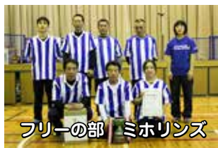
フリーの部 ミホリンズ

ソフトバレーボールは、バレーボールに比べ、ネットが低く、ボールも柔らかいため、突き指などの危険も少なく、誰もが安心して気軽に楽しめるスポーツです。友人、職場、そして家族などでチームを作り、来年度も是非、ご参加ください。