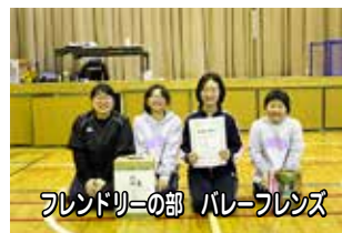
フレンドリーの部 バレーフレンズ