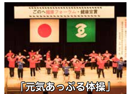
「元気あっがる体操」

五戸町では、このへ健康フォーラム・健康宣言を平成29年11月23日に行いました。町民の取り組み目標とし「健康への五つの戸(と)」を掲げ、「健やかでこころ豊かな五戸町」を目指すことを宣言しました。五つの戸の中の一つとして運動があります。「めんどくさい」「時間がない」を言い訳せず、生活の中でちょこまか動き、1日8,000歩を目標に、体を動かす時間を10分増やし生活習慣の改善につなげる扉を開きましょう。