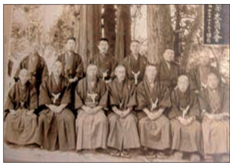
【写真】大正3年正月 五戸同志会結成 20周年記念

郎や松原、泉山、取締役は小熊織三郎や北村、福田らがつとめ、総計144人の名が並ぶ。