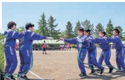
▲1学年男女による団体競技『ムカデ競争』