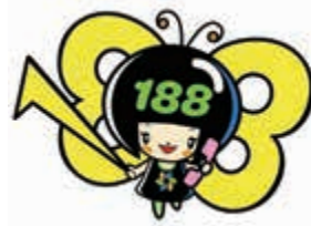
消費者庁 消費者ホットライン 188 イメージキャラクター 「イヤヤン」

一人で悩まず、まずは相談 大切なのは、すぐに相談することです。 困ったときは一人で抱え込まないで 「消費者ホットライン「いやや」（局番なしの188）」までお電話を！ 『泣き寝入りは超いやや（188）！』 で覚えてね