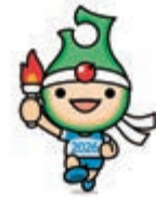
マスコットキャラクター 「アップリート君」

※詳細はホームページをご覧ください。 https://aomorikokuspo2026.pref.aomori.lg.jp/