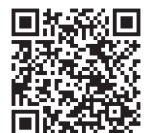
南部バスウェブサイト

ウェブサイトへは、以下QRコード又はバス停に掲示されたQRコードからアクセスしてください。