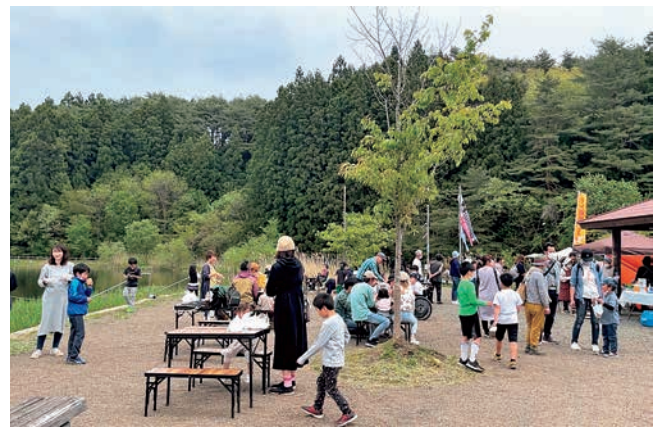
桜沼のちいさなおまつり（桜沼を守る会 主催 [桜沼公園]