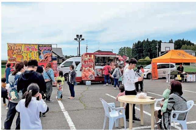
春フェス（喫茶楼 主催 [五戸町スポーツ交流センター]