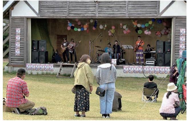
ごのへde春まつり（タイ料理アビ 主催 [小渡平公園]

中でも「ごのへde春まつり」はタイ料理アビによって今回初めて開催されたイベントで、キッチンカーやステージイベントのほか、キャンプゾーン、サウナなど、1日では体験しきれないほどの企画が用意され、子供から大人まで、大いに盛り上がりました。