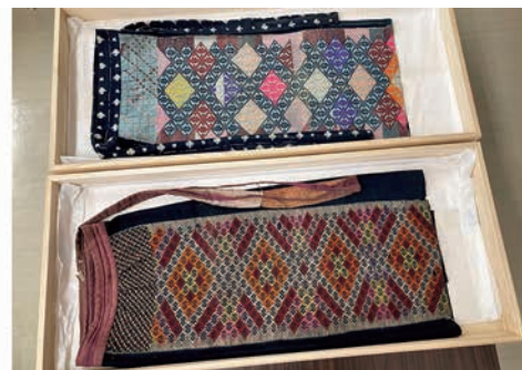
有形民俗文化財に指定された2点の南部菱刺し前かけ