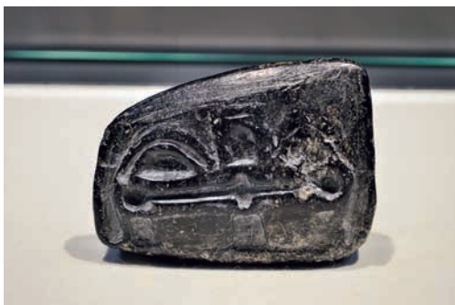
有形文化財に指定された石冠

「石冠」は現在、ごのへ郷土館にて展示中です。「南部菱刺し前かけ」についても、今後準備ができ次第展示する予定です。展示日程等が決まりましたら、お知らせいたします。皆様、どうぞおいでください。