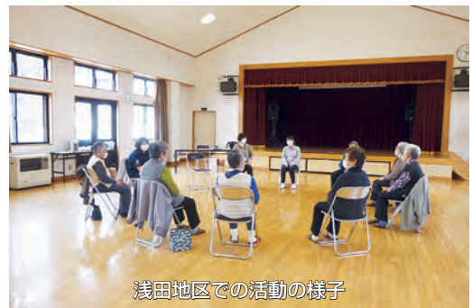
浅田地区での活動の様子