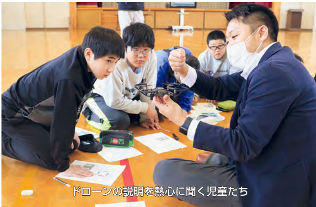
ドローンの説明を熱心に聞く児童たち

3月5日は切谷内小学校で体験会が開催され、児童18名が参加。五戸町ドローンチームの3名がプログラミングでのドローンの飛行の仕方やプロポ(送信機)での操縦方法を子どもたちに教えました。プログラミングでのドローンの飛行では、出された問題に対して子どもたちが自ら考えたプログラミングでドローンを飛ばしました。思い通りにドローンが飛んだときには子どもたちから歓声が上がりました。