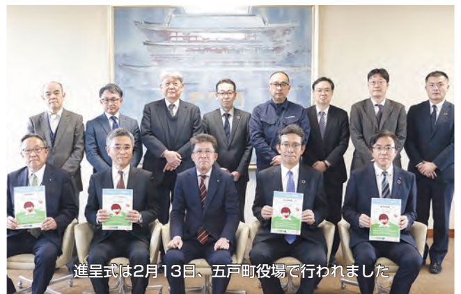
進呈式は2月13日、五戸町役場で行われました

株式会社小坂工務店(三沢市)がJ-クレジット制度に登録した「おんこちゃんの山プロジェクト」は五戸町内の山林における取組です。この度、2022年度の森林管理によるCO2吸収量165トン分がJ-クレジットとして認定を受け、その一部が、電気自動車の共同使用事業によりCO2削減に取り組んでいる県内4社に贈呈されました。